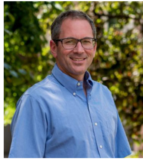
Erik Herzog , Ph.D, Neuroscientifique spécialisé dans les rythmes circadiens chez les mammifères (USA)